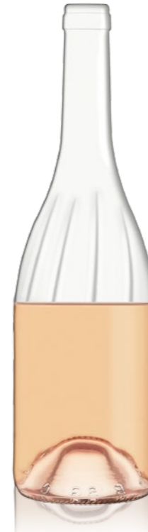
Bourgogne VERTIGO 75cl