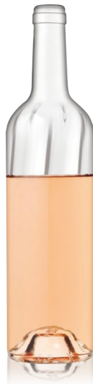
Bordelaise VERTIGO 75cl