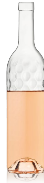
Bordelaise BLING 75cl