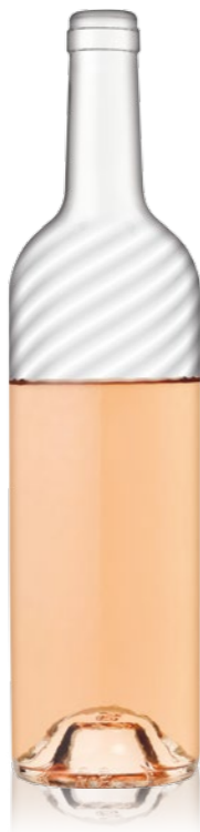
Bordelaise TWIST 75cl