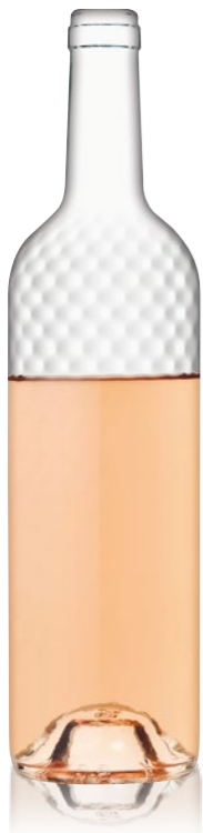
Bordelaise HONEY 75cl