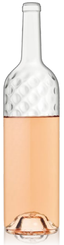
Magnum BLING 150cl